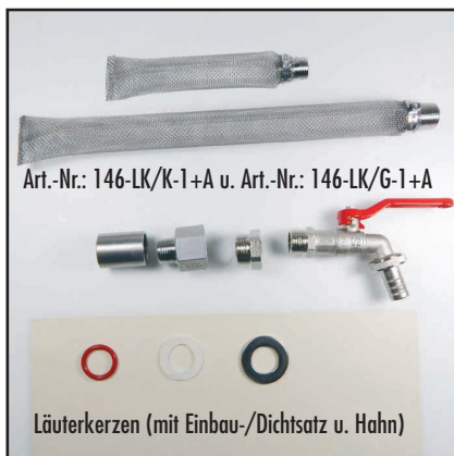
Art.-Nr.: 146-LK/K-1+A u. Art.-Nr.: 146-LK/G-1+A