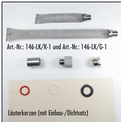
Art.-Nr.: 146-LK/K-1 und Art.-Nr.: 146-LK/G-1