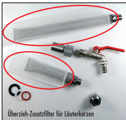
Überzieh-Zusatzfilter für Läu(er)kerzen

»»»» Zum einfachen Selbsteinbau, oder auch eingebaut in unseren hochstabilen, einsatzfertigen Läu(er)bottichen erhältlich.